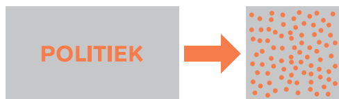
Figuur 2: Vertegenwoordigers leggen complexe politieke vraagstukken neer bij hen die zij zelf vertegenwoordigen.

Schumpeter zegt dat in een representatief democratisch stelsel de beslissingen aan een vertegenwoordiger moeten worden overgedragen, gebeurt dat met een referendum juist niet : complexe politieke vraagstukken worden teruggelegd bij de burgers. En die burgers zijn het (volgens Heywood) per definitie met elkaar oneens. Ook dat vrij eenvoudig te modelleren (figuur 2).