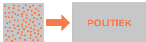
Figuur 1: Individuele burgers laten zich vertegenwoordigen; complexe keuzes worden integraal afgewogen in een representatief systeem van besluitvorming

Het referendum draait het vertegenwoordigende systeem uit figuur 1 als het ware om. Waar