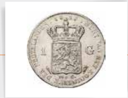
Een gulden uit 1815

van overrompeling en schrik, niet moedig en vereenigd blijft, gaat ten gronde; - maar wanneer zij nog voorouderlijke deugden en moed bezit, wanneer aan haar hoofd een Vorst staat, die op God bovenal bouwt, die den tegenspoed kent, en die, gerust op zijn goede zaak, geruggesteund door de ongeveinsde liefde van zijn volk, en van de trouw zijner bondgenooten overtuigd, het gevaar durft tegemoet te treden, en met spoed, onpartijdigheid en volharding gebruik weet te maken van de middelen, die een krachtige regeringsvorm en de ontvlammende algemeene geestdrift in zijne handen stellen, dan stuit niet alleen de vijand tegen een koperen muur van zelfvertrouwen, dan blijft de natie niet alleen behouden, maar uit het kwaad zelf, wordt menigwerf een goed geboren, dat anderszins niet of moeilijker te bereiken zoude zijn geweest."