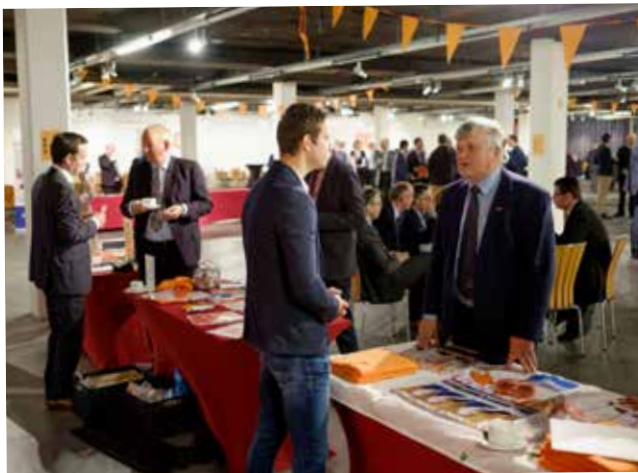
In de ontvangsthall staan verschillende kramen met informatie en promotiemateriaal.