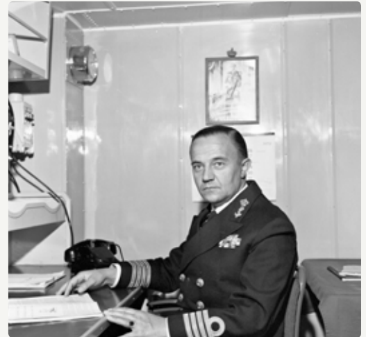
Oud-premier P.J.S. (Piet) de Jong, hier als kapitein-ter-zee van de Koninklijke Marine

De Jong was na een carrière bij de marine 'aan lagerwal geraakt' (zoals hij het zelf zei) in de politiek, eerst als staatssecretaris, daarna als minister van Defensie, en dáár weer na als minister-president. Een man met humor ook. Toen Van Mierlo met veel omhaal van woorden betoogde dat Nederland een minister-president nodig had die zowel bezonken als voortvarend was, stak De Jong z'n vingertje op en zei bedeesd: "Maar dan hebt u aan mij een goeie,