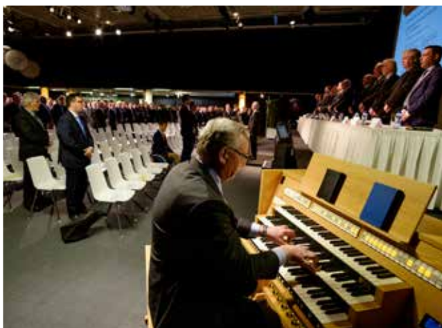
Het Wilhelmus, couplet 1 en 6. Dat slaan we natuurlijk niet over.