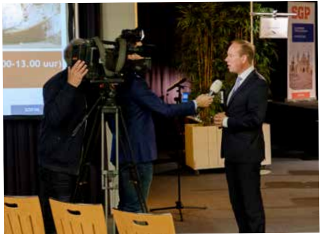
Verschillende media zijn ook vaste bezoekers van de partijdag. Tussendoor is er dan tijd voor een interview voor de camera's.