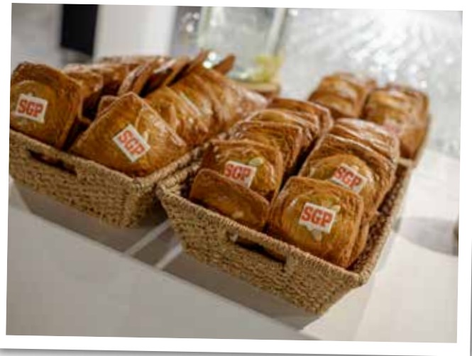
Grote gevulde koeken... Niet om de SGP'ers de mond te snoeren, maar om de sfeer nóg beter te maken.

Op zaterdag 22 april hield de SGP haar laatste partijdag voordat het 100-jarig jubileum van de partij zal worden gevierd. Honderden bezoekers waren weer naar Hoewelaken gekomen om dit jaarlijkse hoogtepunt mee te maken. Afwisselend was er ruimte voor bezinning en ontspanning, huishoudelijke agendapunten en inhoudelijke verdieping. De SGP heeft uw en jouw komst erg gewaardeerd!