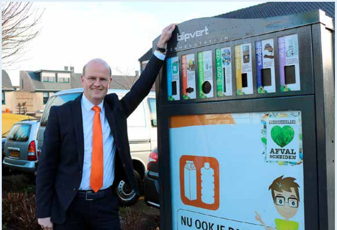
De 'blipvert' is een prachtige manier om veel verschillende afvalsoorten te scheiden

“ALS HET AFVAL GOED WORDT GESCHIEDEN, IS DIT OP LANGERE TERMIJN GUNSTIG VOOR DE TARIEVEN.”