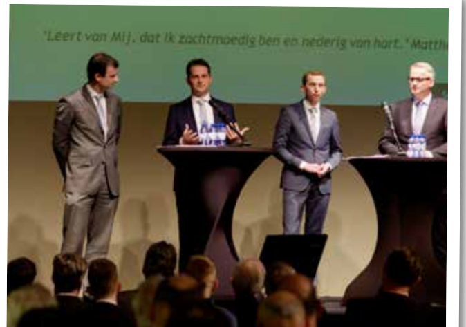
Het morgenprogramma is vooral huishoudelijk van aard. Het middagprogramma is meer inhoudelijk. Een forum laat zich uit over 'kernwaarden'. Wat houdt bijvoorbeeld 'zachtmoedigheid' in voor de SGP'er?