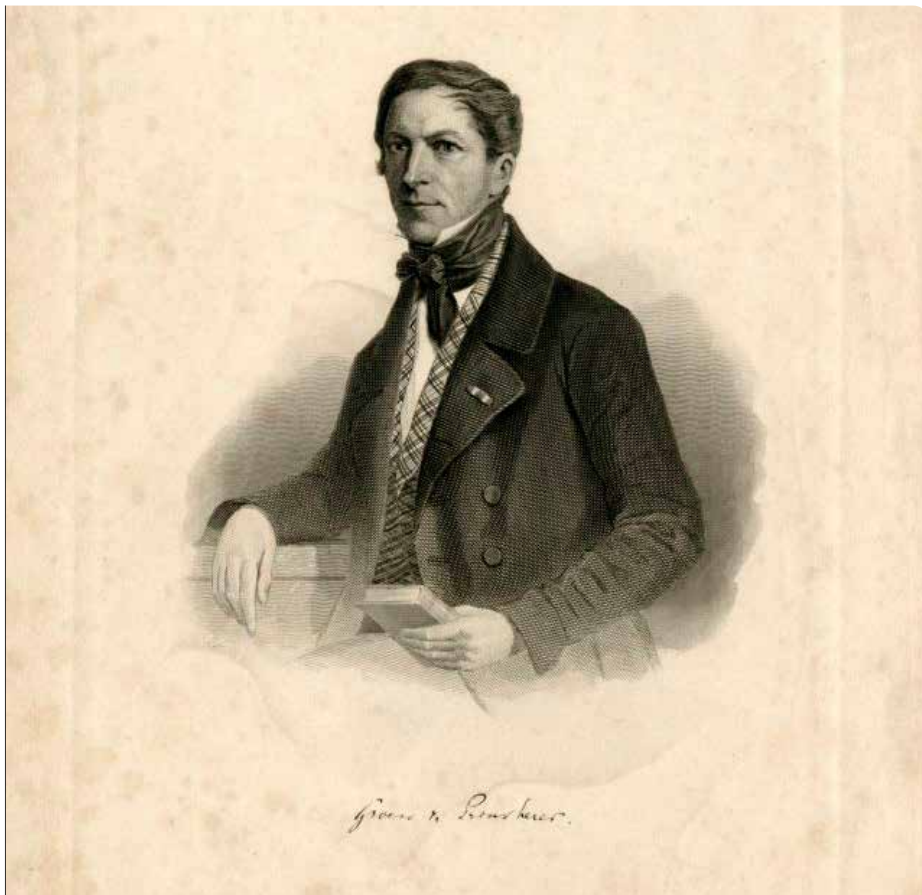
Groen van Prinsterer

Wij weten niet half hoe onvoorstelbaar rijk wij zijn. Nergens in de wereld hebben ze een systeem waarbij scholen van een specifieke richting mogen worden gesticht én dat ze gelijk worden bekostigd met de 'openbare scholen'. Er zijn in het buitenland wel staatsscholen die de christelijke signatuur hebben, maar het is staatsonderwijs. De overheid beslist wat er in de leermiddelen staat. De overheid beslist waar de leerkrachten aan moeten voldoen die worden aangenomen. De overheid beslist welke leerlingen wel of niet op een school toegelaten worden. Net zoals bij ons in de 19e eeuw, is er dan sprake van staatsindoctrinatie. In Frankrijk is de scheiding tussen kerk en staat ver doorgevoerd. Daar is totaal geen ruimte voor christelijk onderwijs. De breuk tussen kerk en overheid was bloedig en scherp. Het is een ander klimaat dan in Nederland waardoor