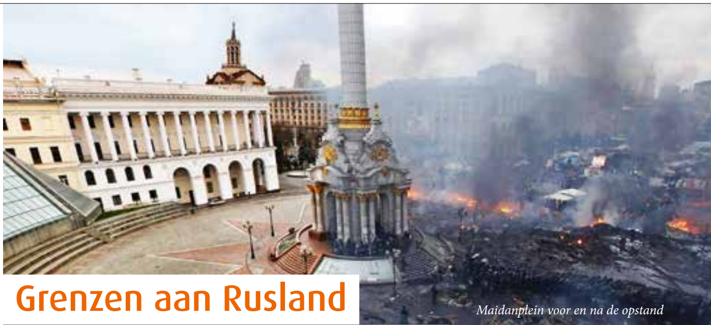
Maidanplein voor en na de opstand