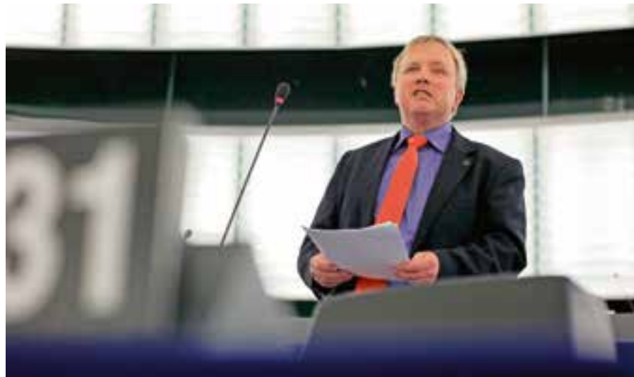
dhr. Skripek, Europarlementariër uit Slowakije.

Skripek: “We moeten er aan werken dat het politieke werk en de wetge-