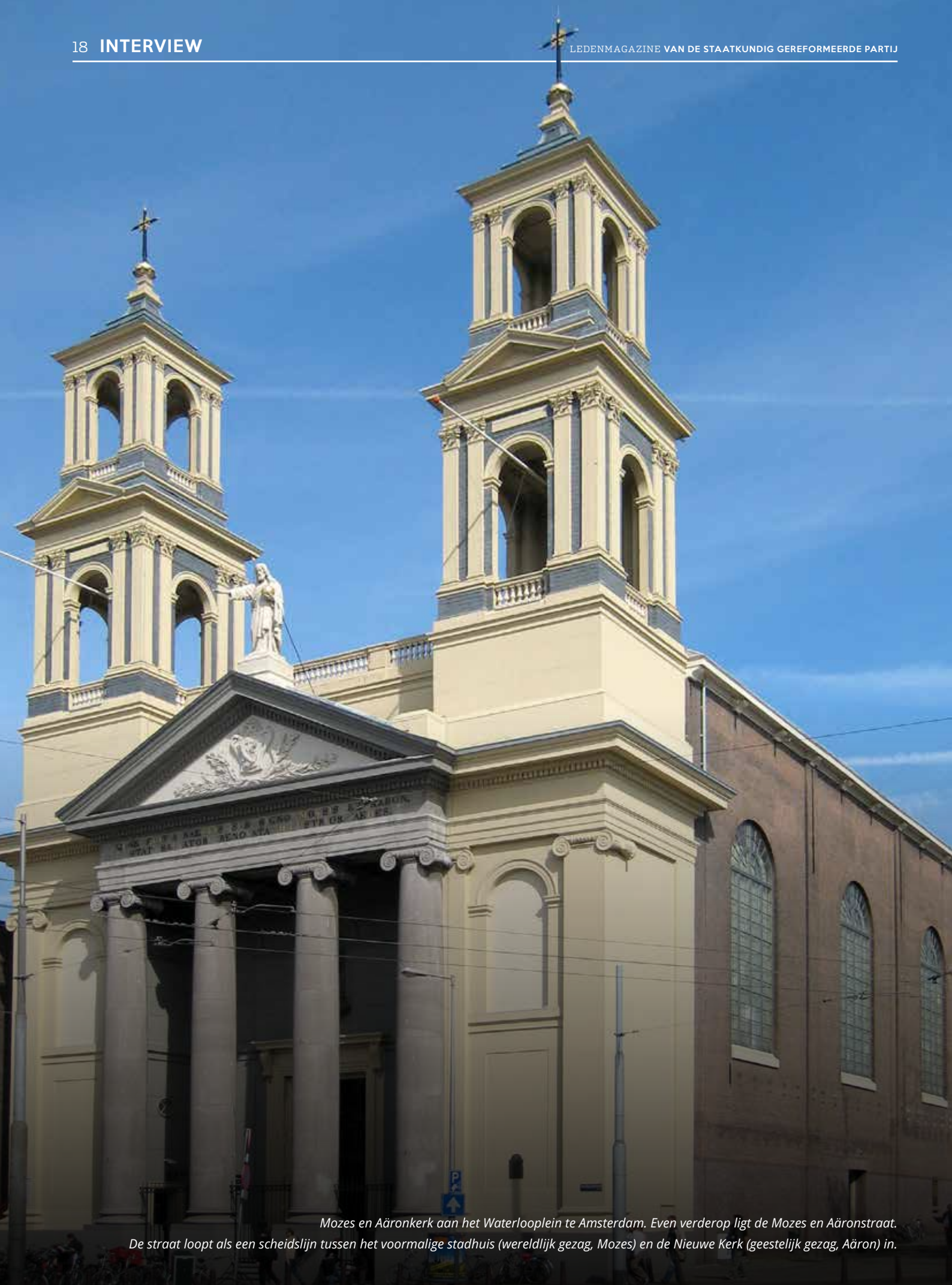
Mozes en Aäronkerk aan het Waterlooplein te Amsterdam. Even verderop ligt de Mozes en Aäronstraat. De straat loopt als een scheidslijn tussen het voormalige stadhuis (wereldlijk gezag, Mozes) en de Nieuwe Kerk (geestelijk gezag, Aäron) in.