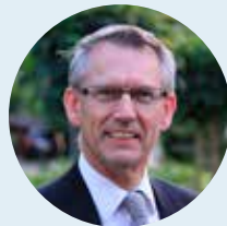
DS. J.P. NAP Hoewelaken

Door de Romeinse keizer in de dagen van Paulus werd God ook niet gediend. Als hij hoorde over de Heere als de 'Koning der koningen' dacht hij: Maar de machtigste, dat ben ik! Maar wat vergiste hij zich. En allen die het vandaag denken (in Nederland en daarbuiten), vergissen zich ook. Alle regeerders en