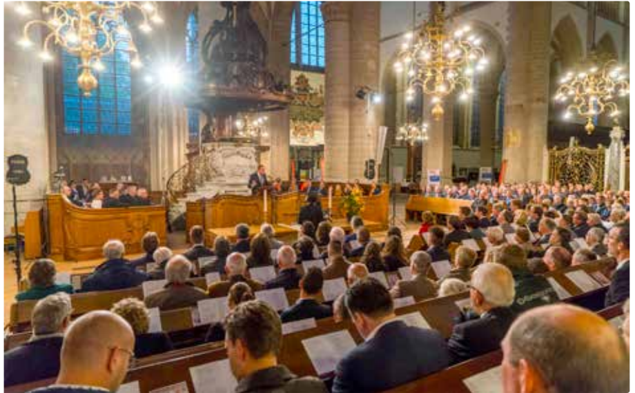
De koppeling tussen religie en politiek gevangen in een beeld van de jubileumviering van de 100-jarige SGP in de Grote Kerk van Dordrecht.

"We weten niet hoe het zal gaan, en de geschiedenis is geen openbaring, maar als ik van de geschiedenis leer, kan ik