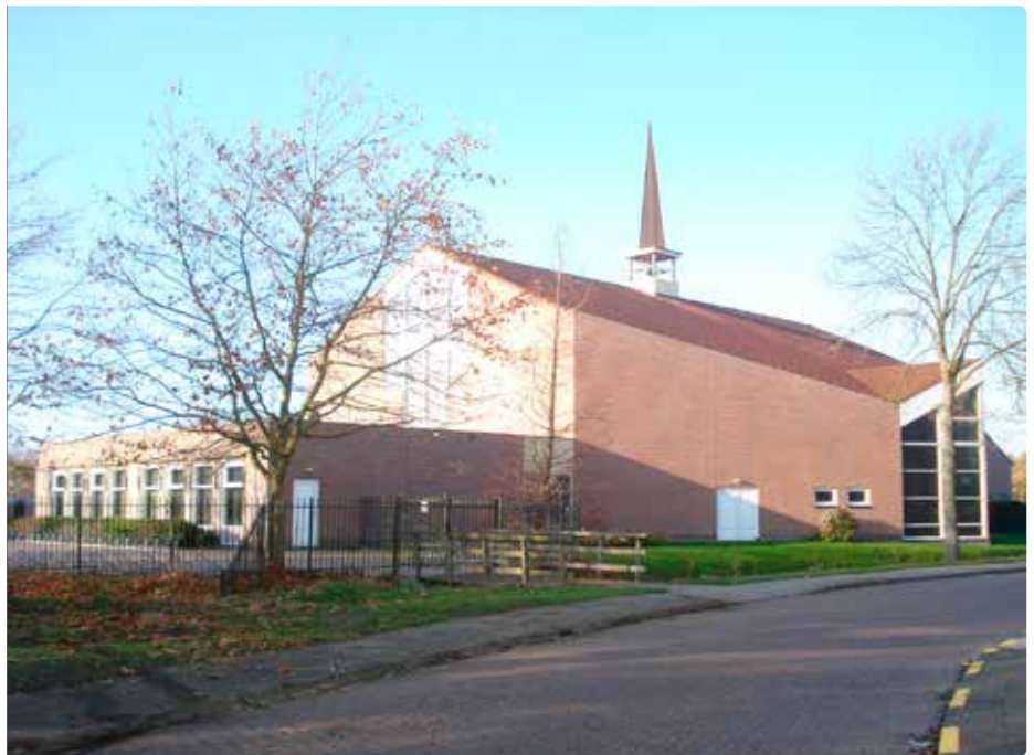
Ter Hoogkerk, Middelburg

Brainstormend op het tweede speerpunt: "Hoe kunnen nog meer doen voor onze eigen gemeenteleden?", is er in iedere wijk van de kerkelijke gemeente een zogenoemde buurtcoördinator aangesteld. Dit voldoet aan de behoefte. Het zijn overwegend dames die deze taak op zich hebben genomen. Zij nemen contact op met mensen uit de buurt na zieken-