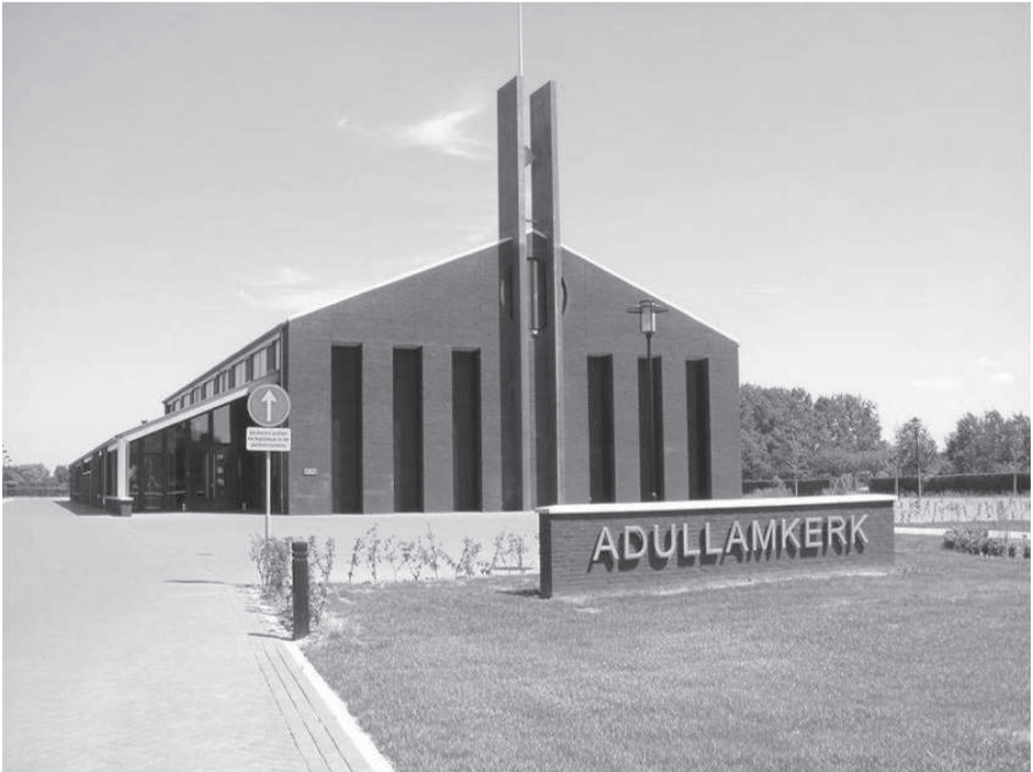
Adullamkerk van de Gereformeerde Gemeente te Waarde