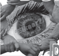
'Oog voor elkaar' D.V. 30 maart 2012