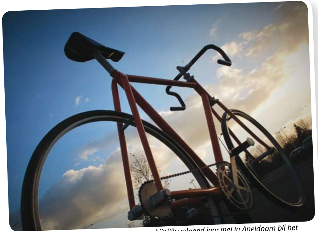
De wielervedstrijd Giro d'Italia start waarschijnlijk volgend jaar mei in Apeldoorn bij het Omnispportcentrum.

Een belangrijk punt is ook de forse overlast. Alleen maar wegen zullen worden afgesloten. Bovendien zullen er veel toeschouwers van buiten Apeldoorn