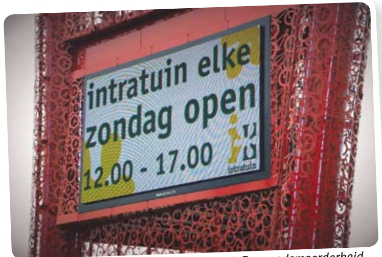
De zondagsrust wordt verder aangetast. Een raadsmeerderheid heeft ingestemd met het vrijgeven van de koopzondagen.

SGP weer tegen deze aantasting van de zondagsrust. „Het vierde gebod van de Tien Geboden roept ons mensen op om de zondag op een goede manier te gebruiken. Gods liefdesgebod is in het geding.” De SGP'er wees de raad erop dat er zegen rust op het houden van Gods geboden, maar dat de Heere Zijn zegen niet verbindt aan het overtreden daarvan. CU en SGP dienden samen nog een motie in om voor winkeliers elke vorm van