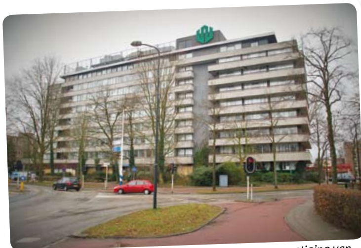
Het gebouw Westpoint moet plaatsmaken voor een vestiging van Albert Heijn.

De SGP is in dit geval voorstander van maatwerk. Er is nog ruimte voor een (niet al te grote) supermarkt in Apeldoorn-West. Er komen ook wat dagwinkels bij, waardoor het geen op zichzelf staand project wordt.