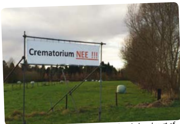
Zuidbroek en Wenum wijzen crematorium in hun buurt af.

gen voor de begraafcapaciteit in Wenum Wiesel. De dagelijkse komst van bezoekers voor een condoleance of crematieplechtigheid geeft extra verkeer. In Zuidbroek zou dat verkeer door de woonwijk moeten rijden. In Wenum Wiesel leefden vooral bezwaren vanwege de smalle wegen en de nu al gevaarlijke Zwolseweg. Bewoners uit