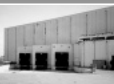
■ industriële bouw