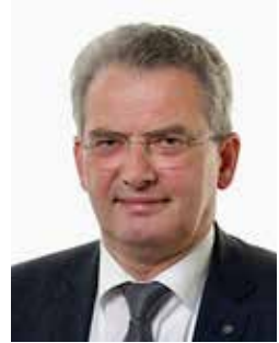
Roelof Bisschop Tweede Kamerlid SGP

De SGP voert Reimerswaal aan. Fijn dat bij de afgelopen gemeenteraadsverkiezingen stemmenwinst geboekt werd en de huidige zeven zetels behouden werden. Maar, Reimerswaal heeft ook de SGP aangevoerd! Ik denk even aan de oprichting van onze partij. De allereerste staatkundig gereformeerde kiesvereniging werd al in 1917 in Krabbendijke 'geboren'. De drijvende kracht achter de oprichting van de partij was ds. Kersten die toen in Yerseke stond. Na Krabbendijke kwamen er ook kiesverenigingen in Yerseke en Waarde, en in vijf andere Zeeuwse plaatsen. Gezamenlijk hebben deze kiesverenigingen op 24 april 1918 in Middelburg de SGP opgericht. Maar, het begon in Reimerswaal!