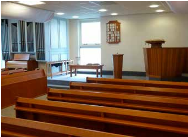
Interieur Hervormde gemeente Rehoboth (PKN) Yerseke

Wat had u gedaan? Zou u blijven zitten? Misschien was het wel de eerste keer in lange tijd dat iemand hem niet als een grof stuk vuil, maar als mens behandelde. De Heiland zag hem en riep hem tot navolging. We moeten niet te snel voorbijgaan aan de diepere betekenis van Jezus' roeping van Levi. Levi was in dienst geweest van de man die zichzelf als koning van de Joden zag, Herodus Antipas. Nu was hij geroepen door de Heere Jezus, de echte Koning der Joden. Hij werd geroepen om Hem te volgen.