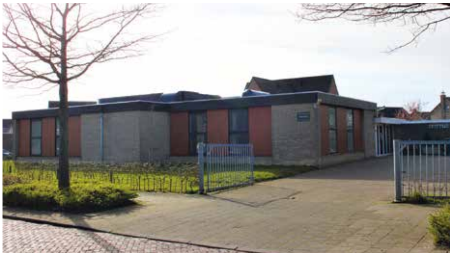
Kerkgebouw Hervormde gemeente Rehoboth (PKN) Yerseke

Zo werkt roept de Heere nog steeds. Hij roept: Volg mij! U, jij die in het tolhuis van de zonde dienen en werken. Jezus ziet u zitten, vast in systemen, ongeloof en zonden. Hij roept ernstig en welgemeend. “Doch zovelen als er door het Evangelie geroepen worden, die worden ernstig geroepen. Want God betoont ernstig en waarachtig in Zijn Woord wat Hem aangenaam is, namelijk dat de geroepenen tot Hem komen. Hij belooft ook met ernst allen die tot Hem komen, en geloven, de rust der zielen en het eeuwige leven. (DL 4.8)