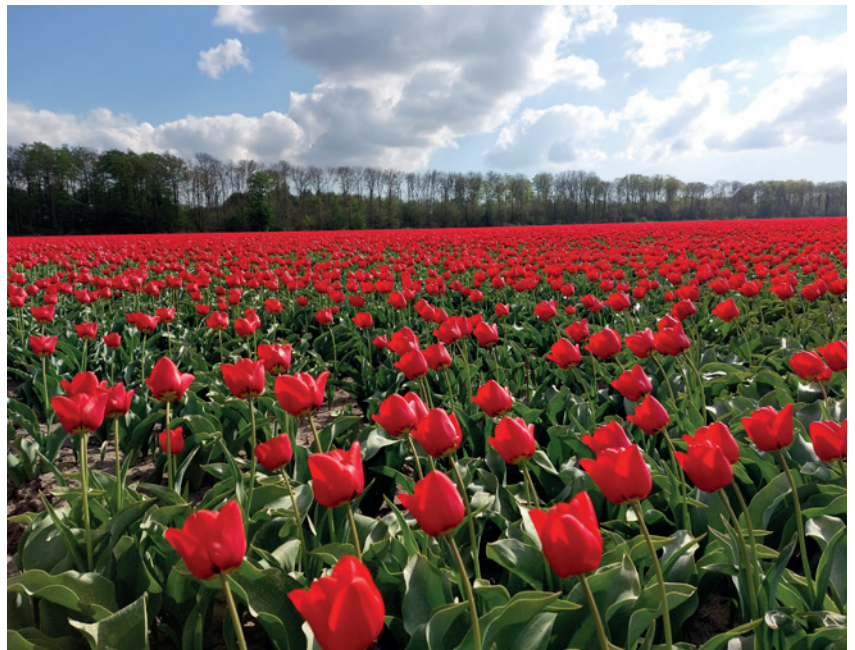
Velen genieten in het voorjaar van de prachtige bloembollenvelden in Flevoland. De SGP waardeert de kleurrijke aanpak van de land- en tuinbouw