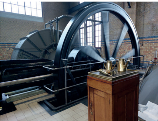
Het waterschap Zuiderzeeland zorgt voor droge voeten en regelt de waterhuishouding. De gemalen zijn daarbij onmisbaar.

terveiligheid waarborgen. De provincie stelt de kaders én ziet toe op een goede uitvoering. De uitvoering ligt bij de waterschappen.