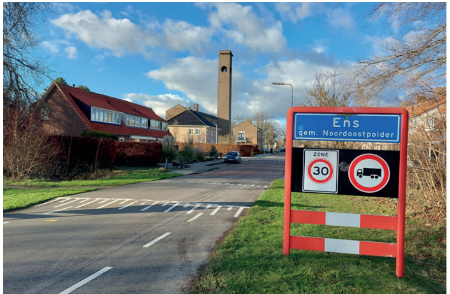
Voor de leefbaarheid in de kleine kernen is het van belang dat er voldoende woonruimte, bedrijfsterreinen en voorzieningen aanwezig zijn