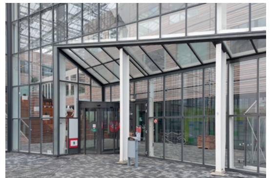
Onderwijs en kenniscentra in Flevoland zijn onmisbaar. - Op de foto de Aeres hogeschool in Dronten – Bedrijven hebben goed opgeleide mensen nodig.

De provincie Flevoland moet zich nadrukkelijk inzetten voor een bijdrage aan het samenbrengen van onderwijs, bedrijfsleven en arbeidsmarkt. We hebben jonge mensen nodig – niet alleen als arbeidskrachten maar ook voor de leefbaarheid. De SGP vindt dat de provincie zich actief moet inzetten voor het onderwijs. Bereikbaarheid en kwaliteit van het onderwijs zijn belangrijk. Innovaties in opleidingen en kennisinstituten moeten worden gestimuleerd. Dat kan door opleidingen aan te bieden die passen bij de bedrijvigheid in onze provincie en bij het karakter van de provincie.