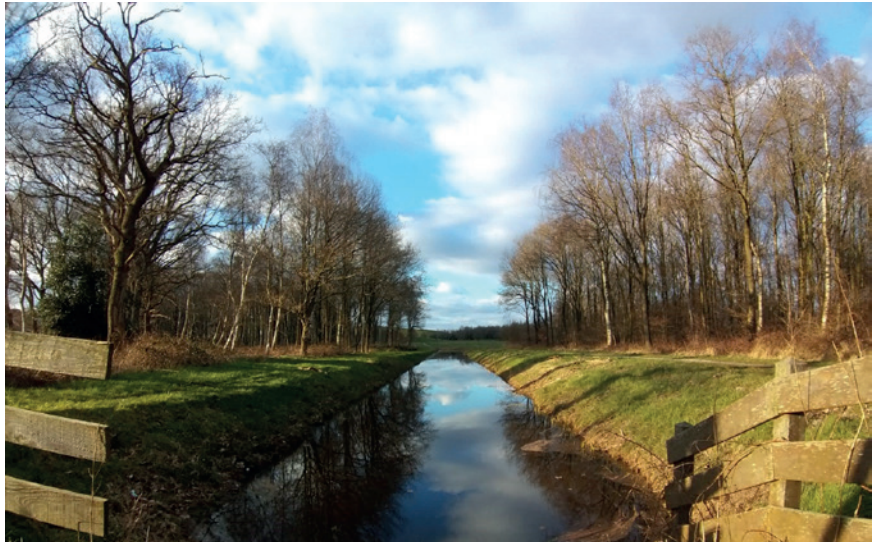
De SGP vraagt aandacht voor voldoende en veilige ruimte voor recreëren, fietsen en wandelen in Flevoland.

De Wet Natuurbescherming is omgezet in provinciaal beleid. Dit houdt in dat de provincie verantwoordelijk is voor vrijwel alle ontheffingen, vergunningen en meldingen én voor handhaving en uitvoering van het natuurbeleid. Daarbij moet een goede en rechtvaardige afweging worden gemaakt tussen natuurdoelen, soortenbescherming en economisch gebruik van het landschap. Redelijkheid en billijkheid moeten voorop staan.