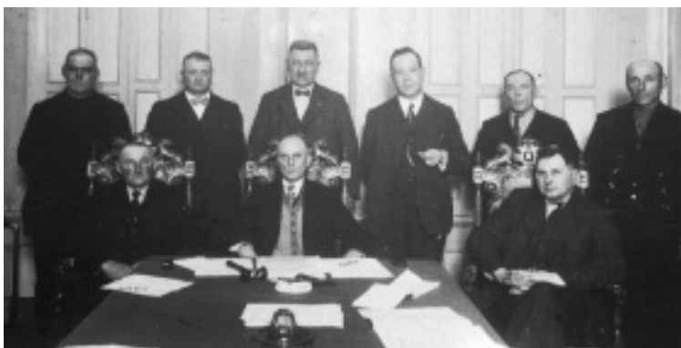
Gemeenteraad Krabbendijkse omstreeks 1927.