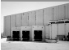
■ industriële bouw