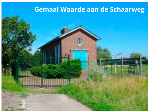
Gemaal Waarde aan de Schaarweg

kiesvereniging in het dorp aanwezig n.l. "God zij met ons" Deze vereniging telt momenteel 119 leden.