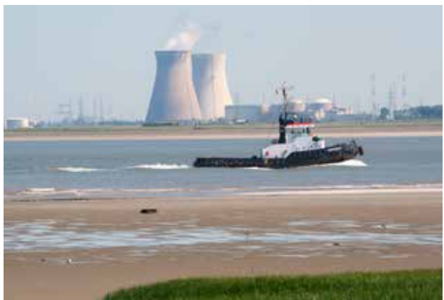
De kerncentrale te Doel.

's Middags worden we geïnformeerd over de aanleg van een wadi (infiltratievoorziening) aan de Marijkelaan te Yerseke, bij de nieuw te