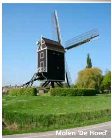
Molen 'De Hoed'