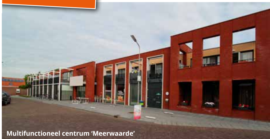
Multifunctioneel centrum 'Meerwaarde'