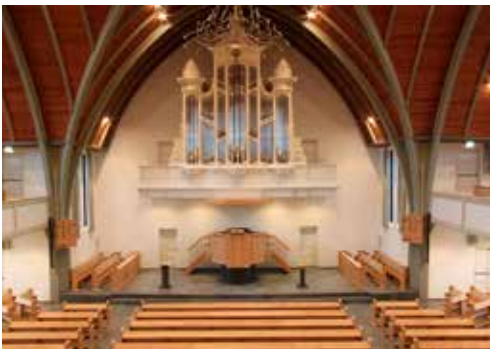
Zondagse kerkgang (GG Krabbendijke).

vragen of hun ouders bij hun op het erf mogen komen wonen. De provinciale en landelijke wetgeving is daar echter nog niet op afgestemd, zodat we daar helaas niet altijd aan mee kunnen werken. Alleen bij een medische verklaring kan er medewerking worden verleend. In dat geval spreken we van een mantelzorgwoning. Daarvan hebben we verschillende goede voorbeelden in onze gemeente. Omdat we