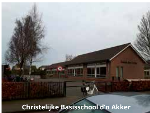
Christelijke Basisschool d'n Akker

kiesvereniging in het dorp aanwezig n.l. "God zij met ons" Deze vereniging telt momenteel 119 leden.