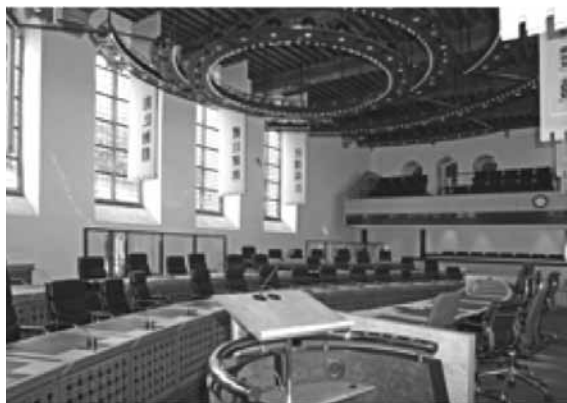
Statenzaal in het provinciehuis te Middelburg