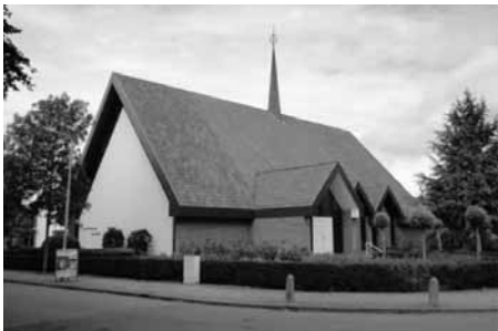
Gereformeerde Gemeente te Kruingen

Plaatselijke Kiesvereniging 'Voor recht en vrijheid' te Yerseke Woensdag 9 juli 2014 om 19.30 uur in de kerk der Gereformeerde Gemeente te Yerseke, ds. G.M. de Leeuw.