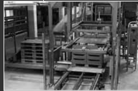
Grootkistvuller met knikband Waterledigers