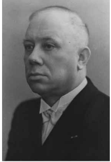
Ds. G.H. Kersten 1882-1948

Vanaf 1922 tot 1945 was hij fractievoorzitter en Tweede Kamerlid voor de SGP, tegelijk was hij ook hoofdredacteur van het partijblad De Banier. In diezelfde week op donderdag 9 september 1948 is ds. Kersten onder grote belangstelling te Rotterdam-Crooswijk ter aarde besteld.