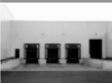
■ industriële bouw