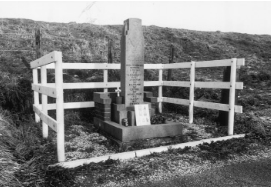
Monument Noorddijk Krabbendijke